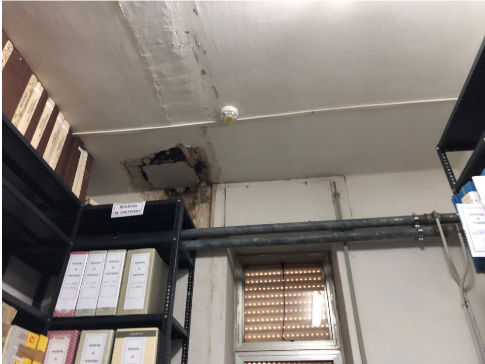
Foto dell'attuale stato dei locali