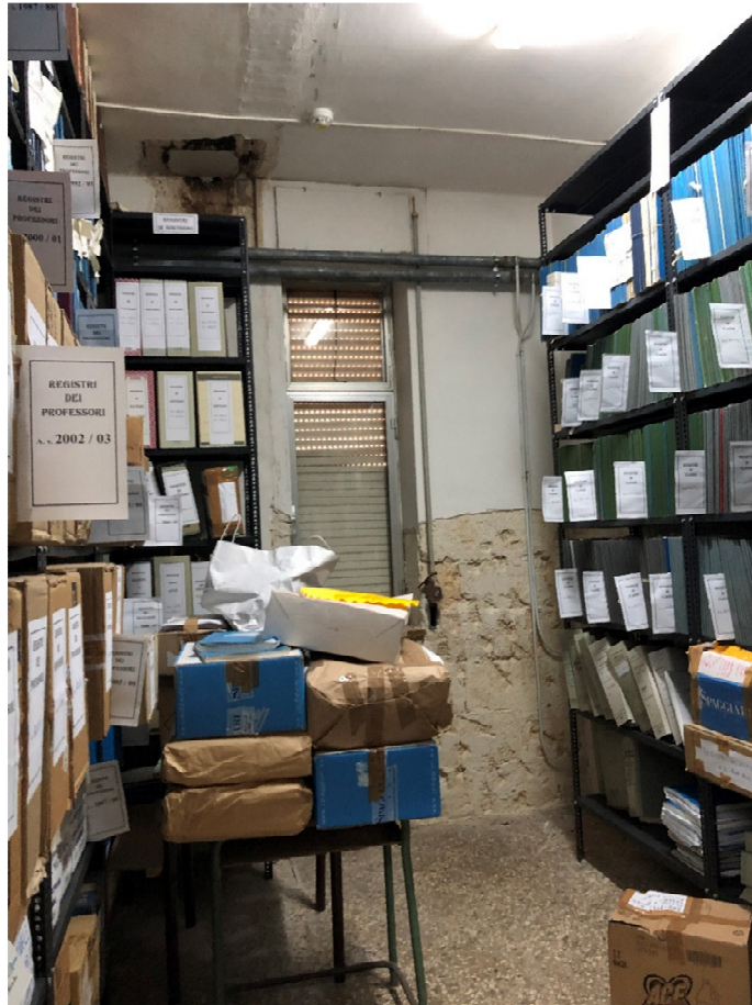
Foto dell'attuale stato dei locali

A seguito dell'emergenza sanitaria da Covid-19 e dopo dettagliate e puntuali analisi dello stato dei luoghi, è emersa la necessità di intervenire per adattare funzionalmente degli spazi attualmente inutilizzati e favorire il necessario distanziamento tra gli studenti realizzando uno spazio didattico da destinare a LABORATORIO. Si tratta in sintesi di adeguare l'ex alloggio del custode della scuola, utilizzato per un periodo come archivio, mediante la demolizione di tramezzi interni e del bagno, il ripristino delle finiture interne e l'adeguamento degli impianti relativamente alla sola zona interessata.