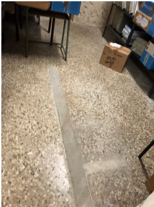
Foto dell'attuale stato dei locali