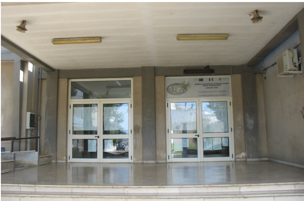
Ingresso da via Pietro Elia

L'edificio di due piani fuori terra ha una pianta di forma irregolare, destinata ad aule didattiche e locali accessori. E' circondato da uno spazio scoperto ed è completamente delimitato da robusta recinzione.