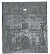
BENI CULTURALI DI LATIANO IL CASTELLO E LA QUADRERIA IMPERIALE

a cura di A. BENVENUTO, F. LOTESCORIERE, T. NACCI, S. MADAGHIELE, M. RUBINO, F. SCARAFILE BIBLIOTECA COMUNALE - LATIANO 1993