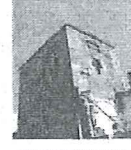
BENI CULTURALI DI LATIANO IL CASTELLO E LA QUADRERIA IMPERIALE